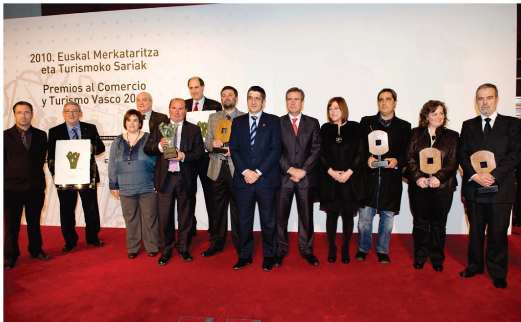
En imagen todos los galardonados en los Premios de Comercio y Turismo de Euskadi

Turismo Los galardones unen por primera vez turismo y comercio